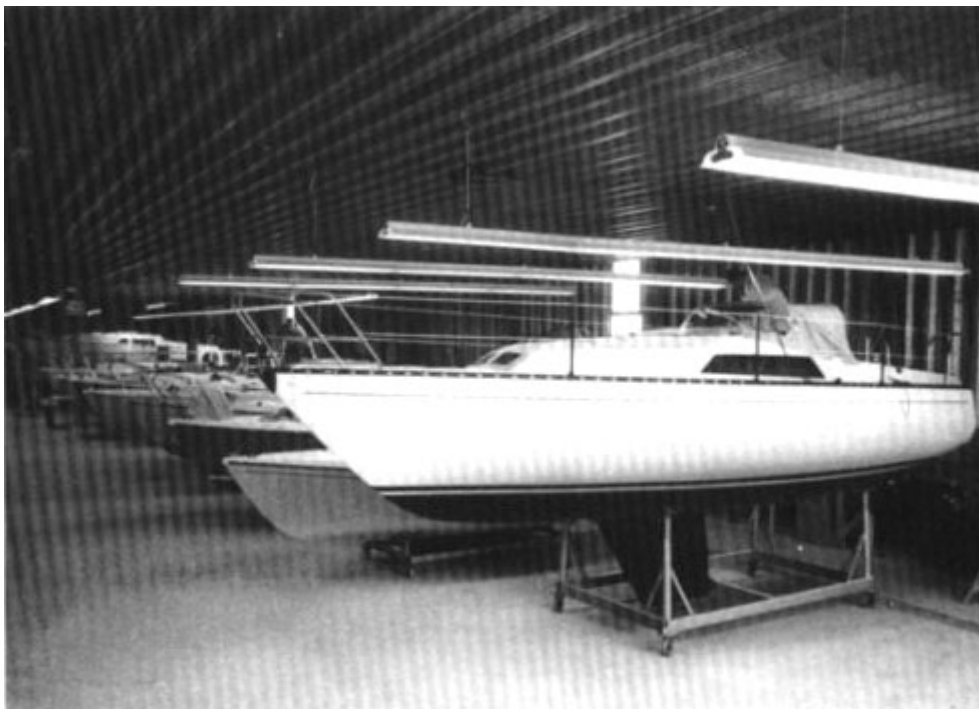
Vor der Auslieferung durchlaufen alle Schiffe eine strenge Endkontrolle

Unabhängig von den beiden Grundausstattungen können Sie aber auch ein segelfertiges Schiff kaufen, an dem Sie alles nach Ihren Vorstellungen einrichten. Und Sie können sich dabei Zeit nehmen. Denn was Sie zum Segeln wirklich brauchen, ist in dieser Standard-Ausführung selbstverständlich vorhanden.