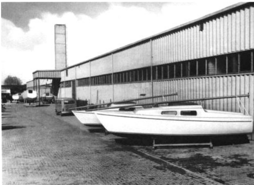
Moderne Werkshallen für einen hochqualifizierten Schiffsbau

Unsere Händler geben Ihnen gern jede weitere Auskunft über unsere Schiffe. Das Typen- und Ausrüstungsprogramm ist so vielseitig, dass es sicherlich möglich sein wird, auch die besonderen Vorstellungen zu verwirklichen, die Sie von Ihrem neuen Schiff haben. Wir sind uns dieser Aufgabe bewusst: Denn eine unserer Neptun-Yachten soll künftig den Namen tragen, den Sie für sie ausgewählt haben.