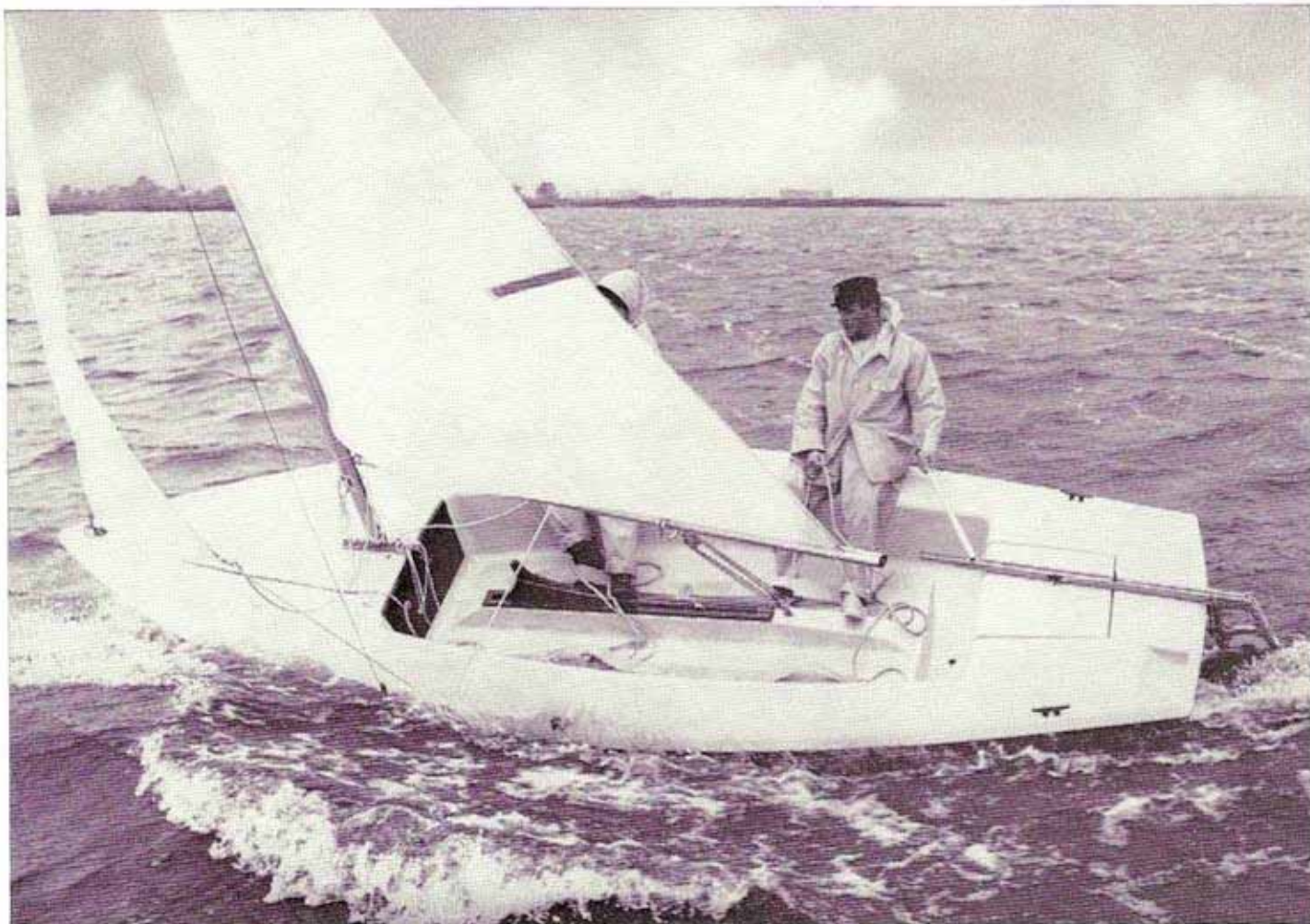
»NEPTUN 17 Wanderjolle« segelfertig mit Großsegel und Fock I (einschl. Mehrwertsteuer) DM 3 895,—